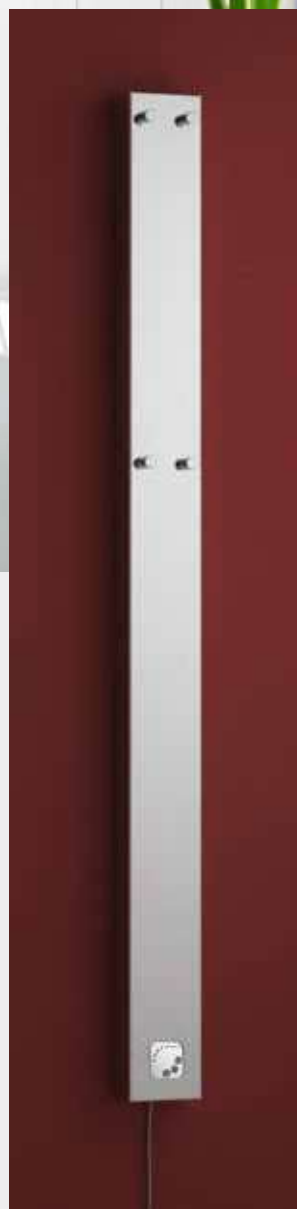
JUNO provedení chrom 124 × 1607 mm