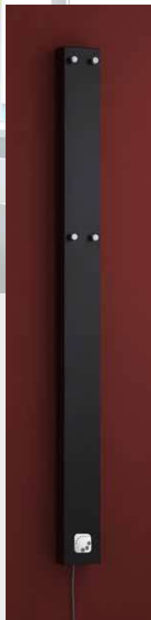
JUNO provedení strukturální černá 124 × 1607 mm